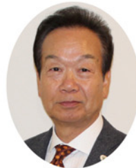
武蔵村山市長 藤野 勝