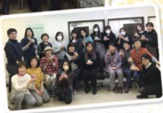
コサージュ作り講習会

商工会女性部は、商工会員、もしくはその配偶者又は親族であり、商工業に従事している女性の方ならどなたでも加入できます。研修活動、地域振興活動、広報活動などを通して部員相互の親睦や資質の向上を図ることを目的とし、さまざまな活動を通じ、地域における女性の貴重なコミュニケーションの場になっています。現在、部員数83名(R2.12月現在)で活動しています。皆様のご参加をお待ちしております。