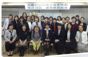
女性部通常部員総会