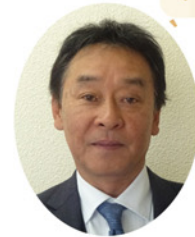
武蔵村山市商工会 会長